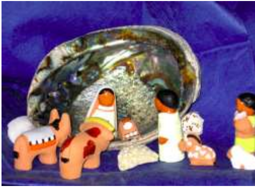
Image de Notre Dame de Jourarre